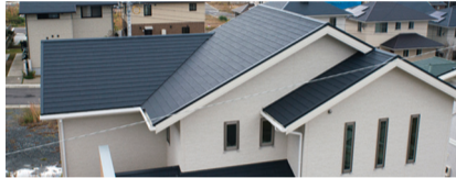
ケイミュー コロニアルグラッサ